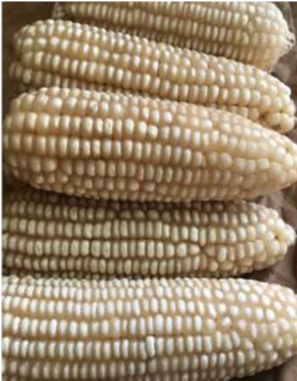
Figure 2 : CSIR- Kum - naa - ya, Variété de maïs hybride climato-intelligente