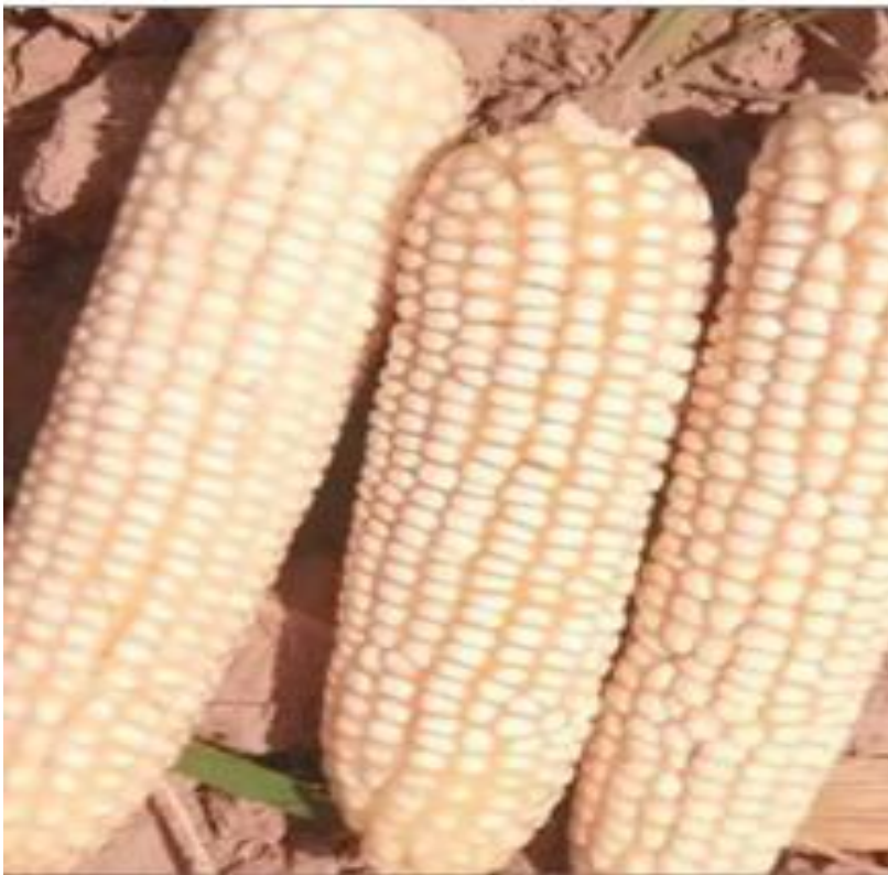
Figure 2 : CSIR-Wang Basig, Variété de maïs hybride climato-intelligente